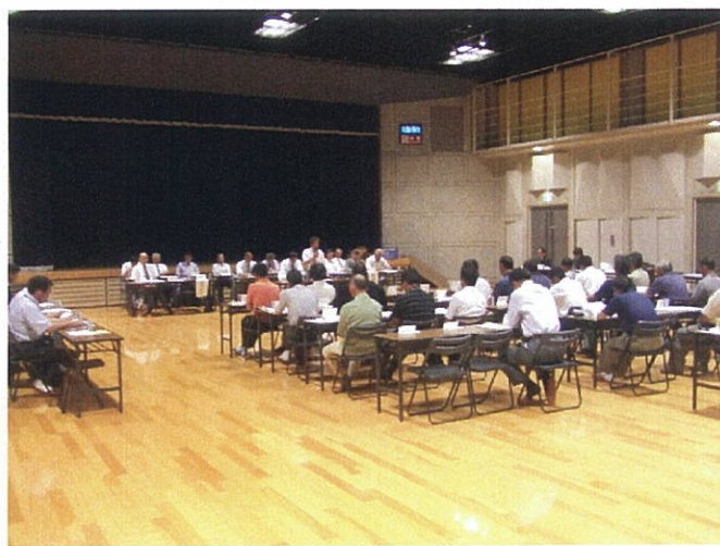
慎重に審議され全議案可決いたしました。